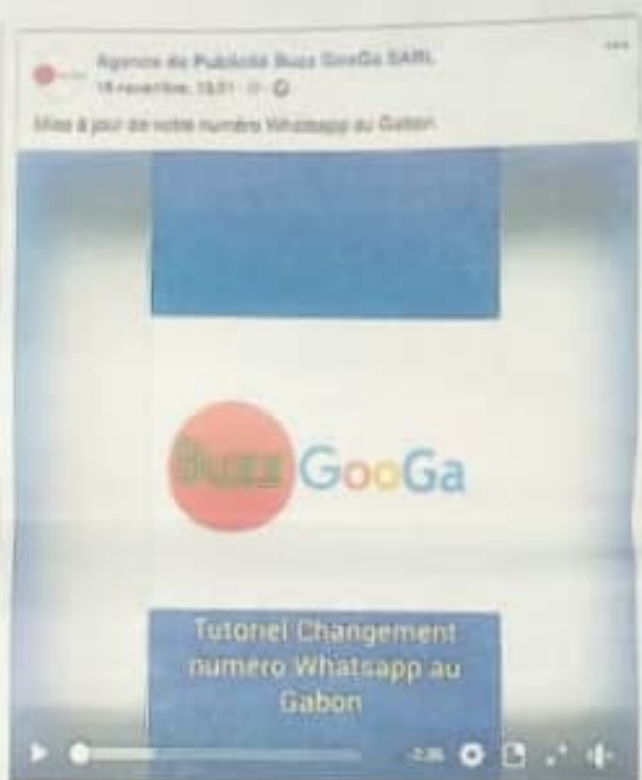
La page Facebook de l'entreprise Buzz Googa.

Mail », explique le responsable de cette structure. La page Facebook de l'entreprise Buzz Googa compte plusieurs milliers de followers par jour.